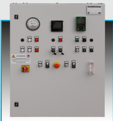
Quadro elettrico / Control console

(*)In collaborazione con/ In cooperation with GORE REMEDIA .