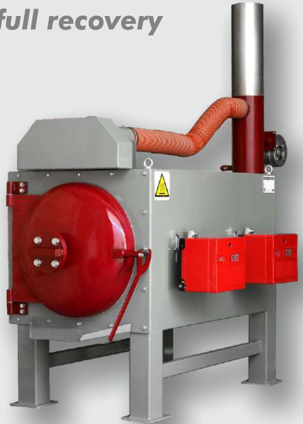
Versione PC PC Option

(**) Theoretical and not binding parameters